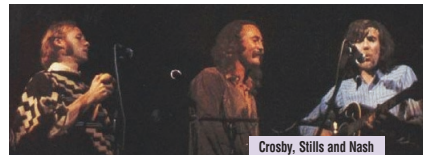
Crosby, Stills and Nash

A hatvanas évek beatkorszakának máig ható rocktörténeti helyszínén magyar bulira készülnek. A hazai könnyűzene legrangosabb képviselőinek névsorát egyelőre nem árulják el a szervezők, részben, mert a jövő év májusára tervezett koncerteken részt vevők tábora még változhat, részben pedig a meglepetések okán. Annyi biztos, hogy csak olyan művészek lépnek majd fel, akiknek a neve a legjobban cseng ebben a műfajban.