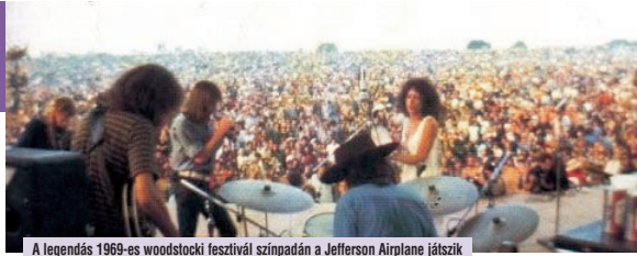
A legendás 1969-es woodstocki fesztivál színpadán a Jefferson Airplane játszik