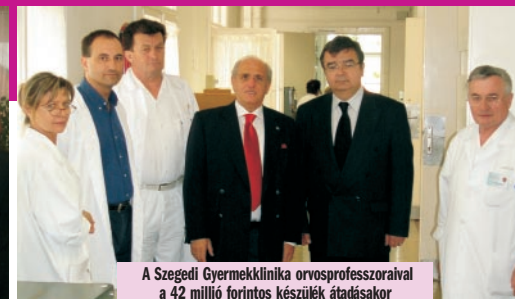
A Szegei Gyermekklínika orvosprofesszoraival a 42 millió forintos készülék átadásakor

Magyarország leglátogatottabb szervezete a Gyermekrák Alapítvány