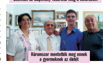
Háromszor mentették meg ennek a gyermeknek az életét