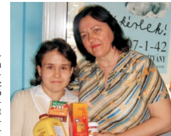
Az alapítvány nélkül nem tudnák kifizetni a gyógyuláshoz nélkülözhetetlen táplálék-kiegészítőket árát