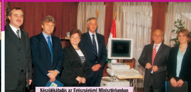
Készülékátadás az Egészségügyi Minisztériumban