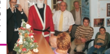
Mikulásünnepség az Alapítvány irodájában