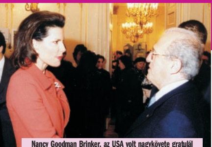
Nancy Goodman Brinker, az USA volt nagykövete gratulál