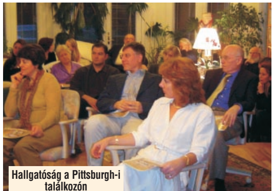
Hallgatóság a Pittsburgh-i találkozón