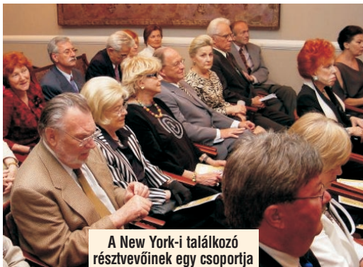
A New York-i találkozó résztvevőinek egy csoportja