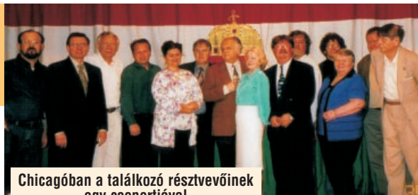
Chicagóban a találkozó résztvevőinek egy csoportjával